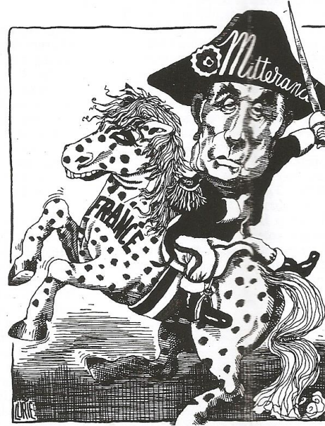
Next Premier of France

Francois Mitterrand es el primer político que entendió y puso en práctica la enigmática frase de Charles de Gaulle. En efecto Mitterrand comprendió que el secreto del poder presidencial en una república moderna es el de guardar el poder sin aplicarlo. Este debe permanecer transparente, planeando como un fantasma sobre el campo político de un país, aplicándose únicamente en casos graves y extremos -es decir aquellos en los que se está seguro de la victoria política, sin utilizarlo por todo y para todo, para evitar el principal peligro del poder: el de usarse . Mitterrand comprendió igualmente que el poder debe aplicarse con una máscara; por eso el presidente galo utiliza perfectamente sus hombres, como cartas de poker. Esto es todavía más impresionante cuando los hombres utilizados no corresponden al color político del presidente; es decir cuando es en nombre del interés del país y no en el del partido socialista que se les hace actuar.