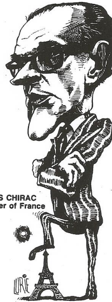
JACQUES CHIRAC Next Premier of France

A la pregunta más sutil: "Quién es el director de orquesta de la cohabitación política en Francia? Los realistas, es decir, los que se contentan con mirar los hechos inmediatos sin imaginar que hay algo más fuerte detrás, responden: Chirac y el Parlamento. Mas la pre-